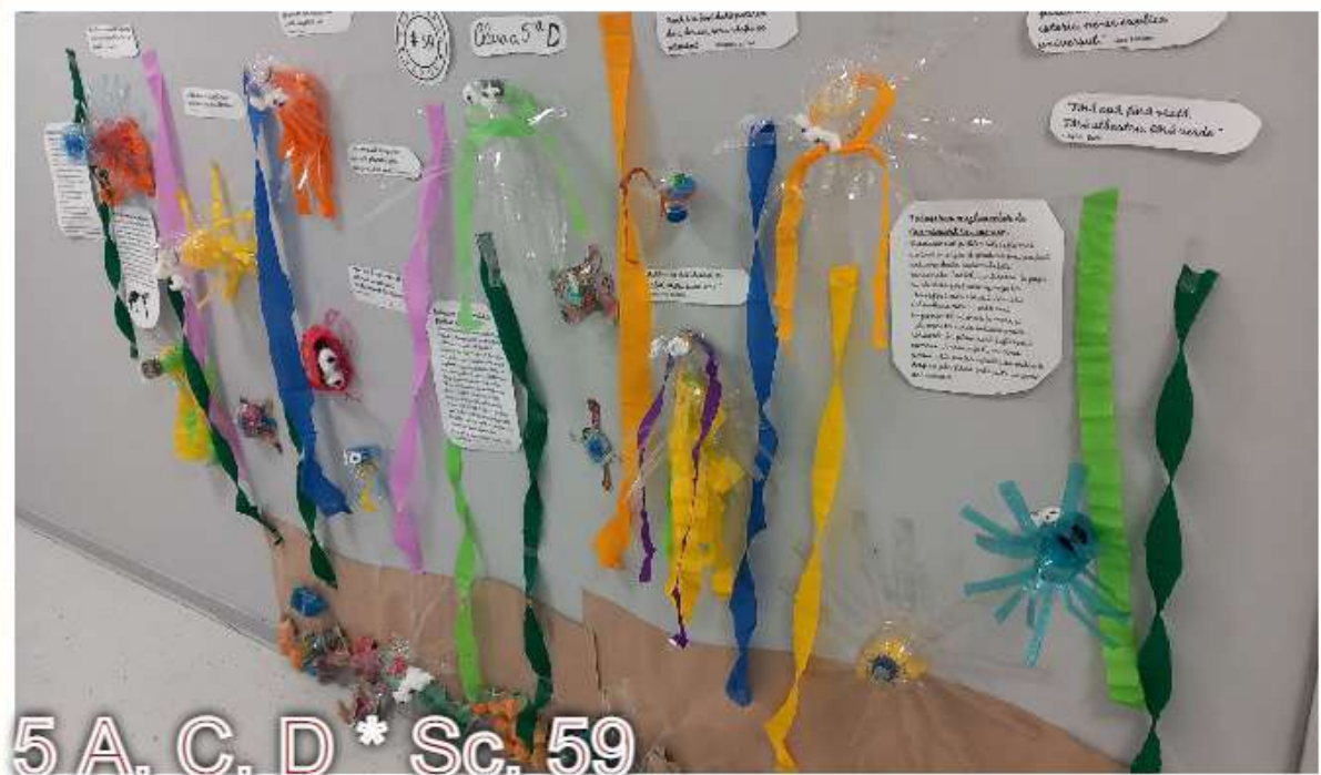
5 A, C, D * Șc. 59